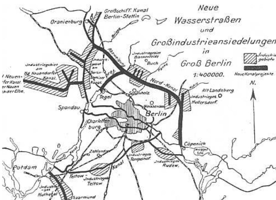
Nordkanal mit Industrieansiedelungen (Ausschnitt) (Verlag Ernst Wasmuth AG 1911)

Ein wichtiges für das Funktionieren der Großstadt Berlin notwendiges Projekt war der Ausbau eines leistungsfähigen Kanalisationssystems mit Rieselfeldern für die Klärung der Abwassermassen. Nach Entwürfen des Stadtbaurates James Hobrecht und unter Mitwirkung des bekannten Arztes Rudolf Virchow begann 1873 der Bau der unterirdischen Entwässerung. Im nordöstlichen Umland erwarb der Magistrat ausgedehnte Flächen und legte Rieselfelder an.